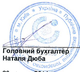
Головний бухгалтер Наталя Дюба